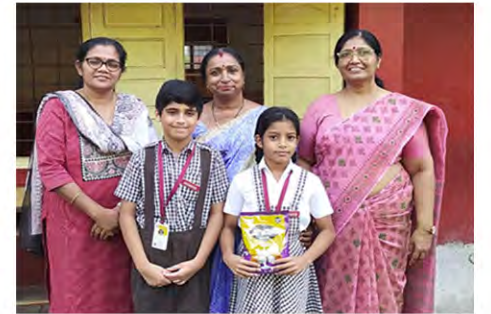
Class IV B: The best division in Grade 4