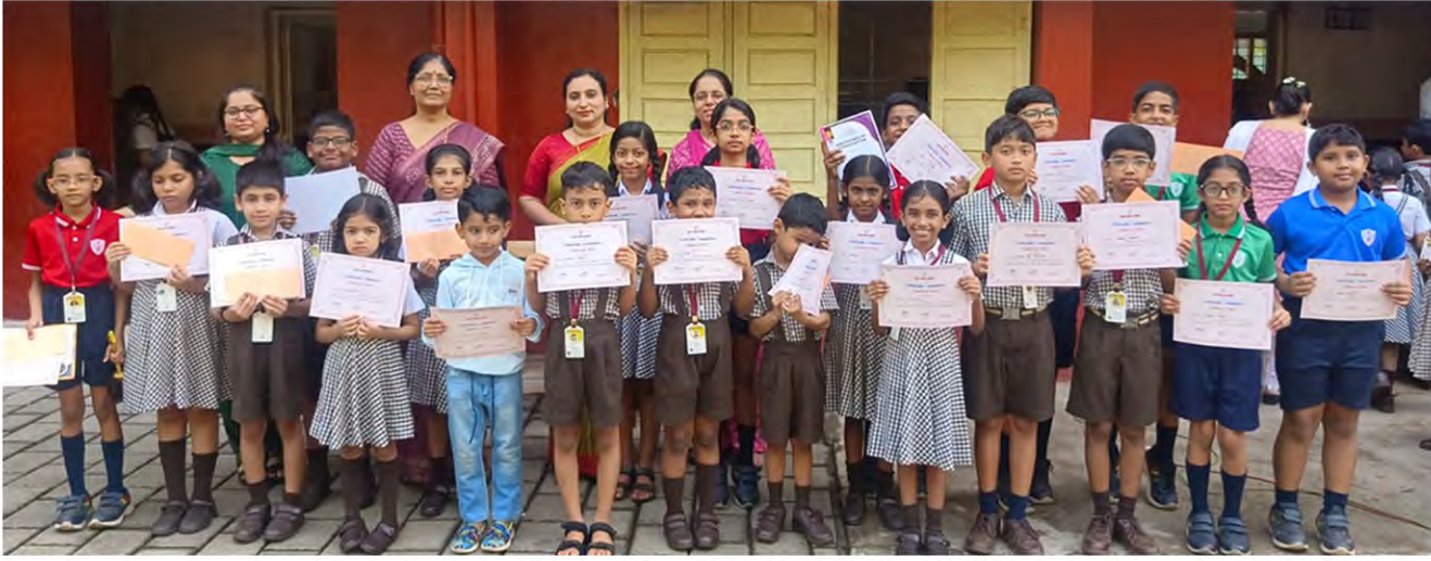
Consolation prize winners in L.P. Section: School level Knowledge Space Exam