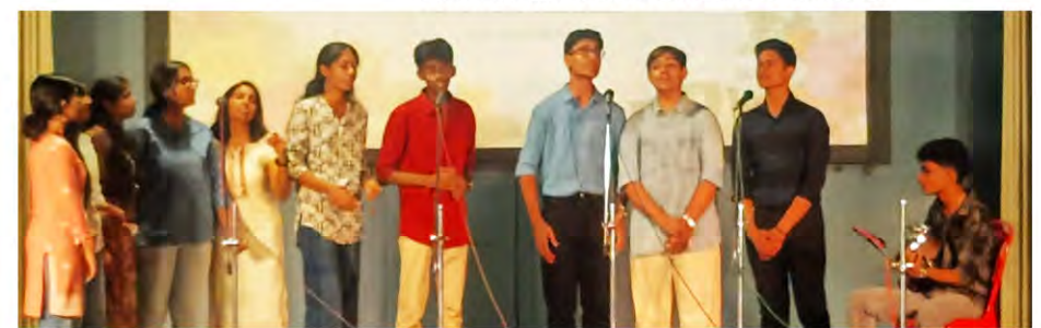
Musical performance by the children