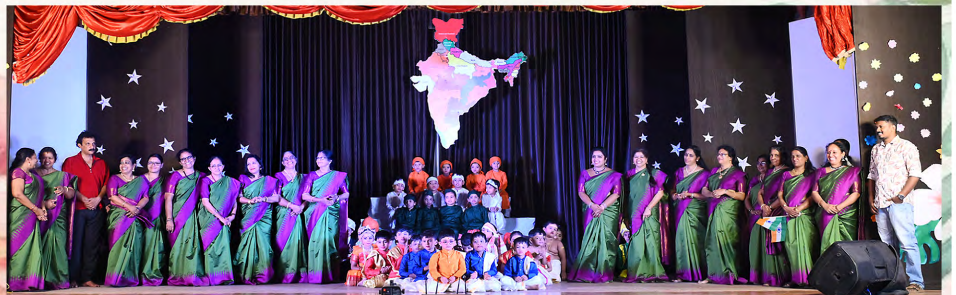
National Integration participants along with the team of nursery teachers