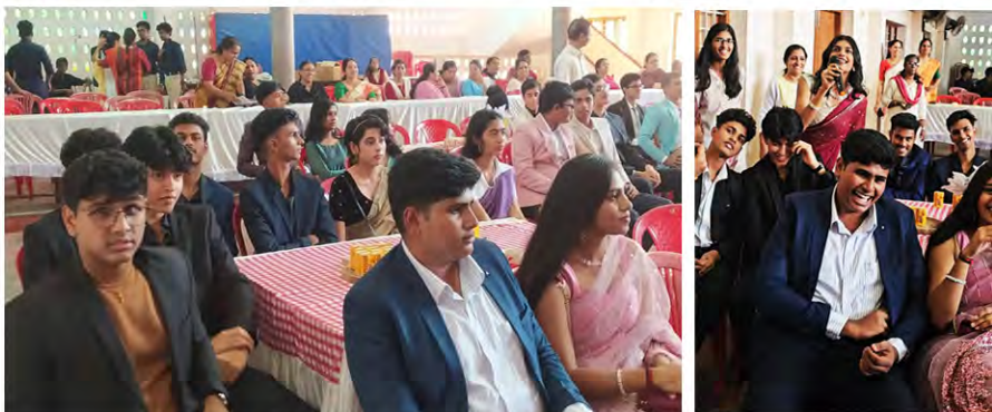
Plus Two outgoing children in the auditorium