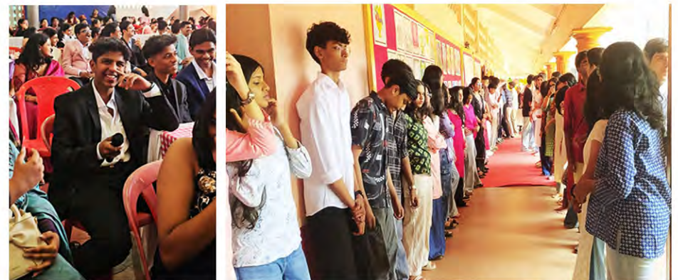
Plus One children standing in front of the auditorium to receive their seniors