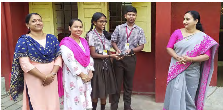
Class VIII A: The best division in Grade 8