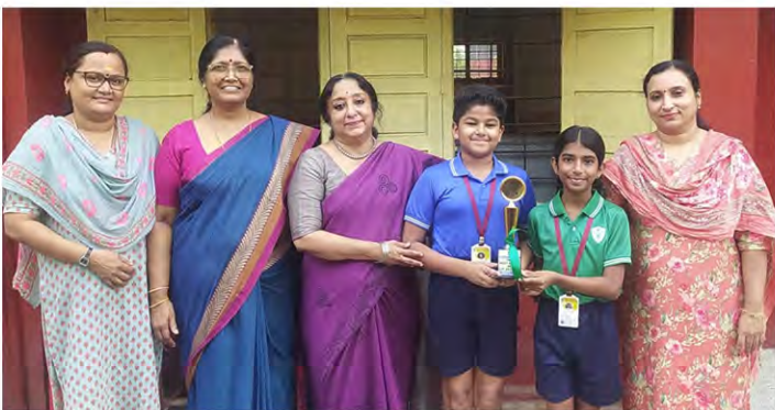
Class V B: The best division in Grade 5 and the best Class in U.P. Section