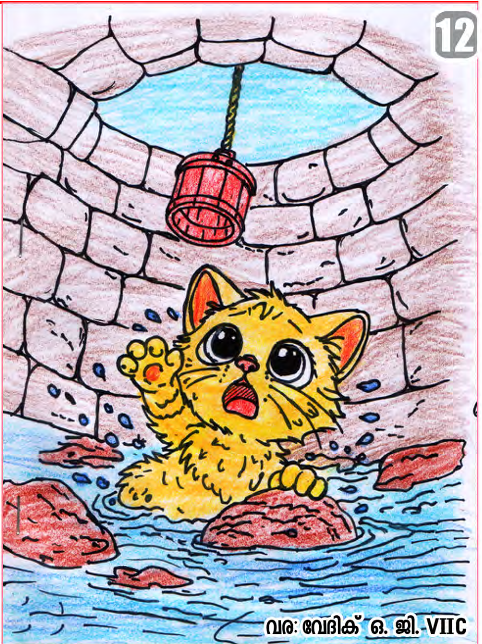
വര: വേദിക് ഒ. ജി. VIIC

13. അർദ്ധരാത്രിയുടെ നിശബ്ദതയെ കീറിമുറിച്ചുകൊണ്ട് കിണറ്റിന്റെ ആഴങ്ങളിൽ നിന്ന് ആ ദീനമായ കരച്ചിൽ ഉയർന്നു. വിറയാർന്ന ഒരു 'മ്യാവു'! മരണത്തിന്റെ തണുപ്പുള്ള വെള്ളത്തിനടിയിൽ, ഇരുട്ടിന്റെ കൈകളിൽ അകപ്പെട്ടുപോയ ഒരു കുഞ്ഞുജീവൻ.