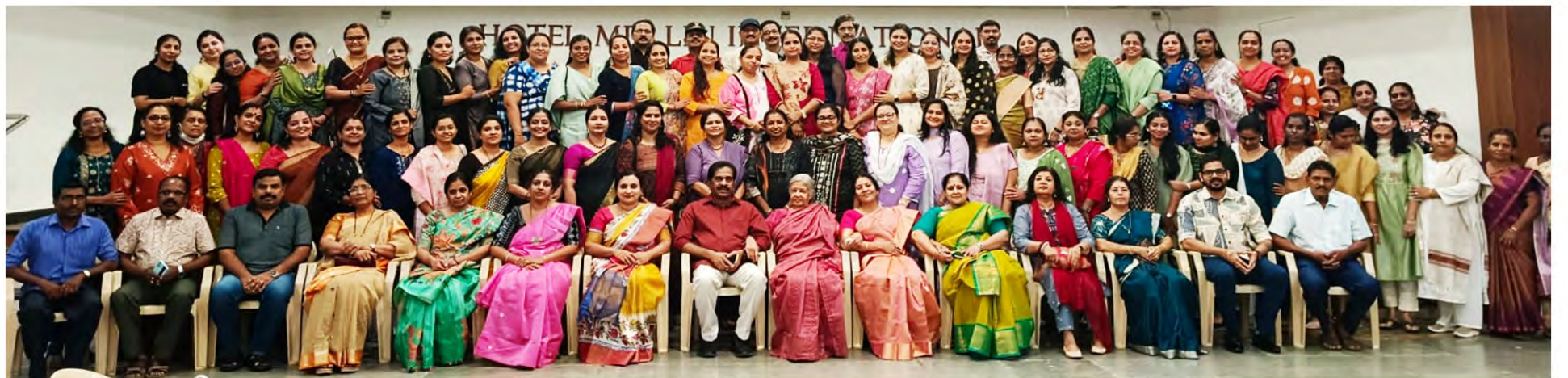
The staff posing along with the Executive Committee members during the get-together function