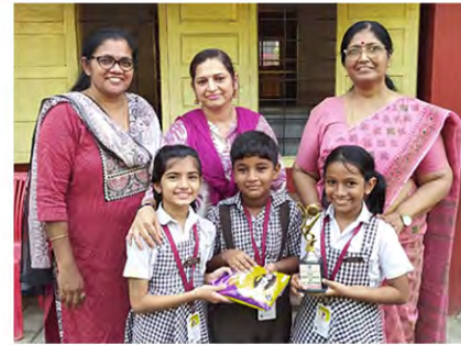
Class III D: The best division in Grade 3 and also the best class in the L.P. Section