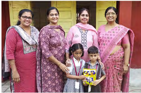
Class I A: The best division in Grade 1