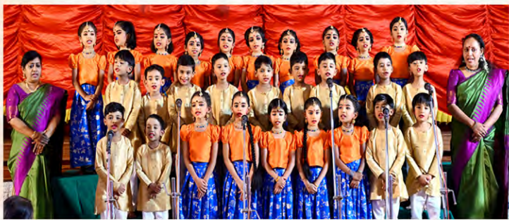
Nursery School Choir