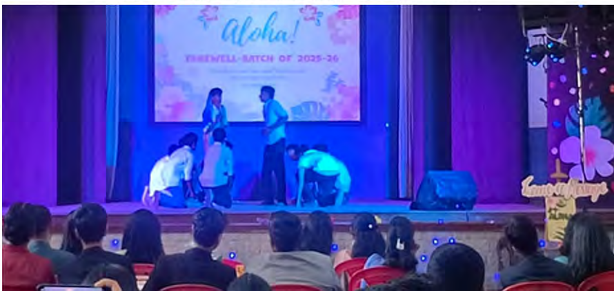
Plus One children performing a skit relating to the farewell