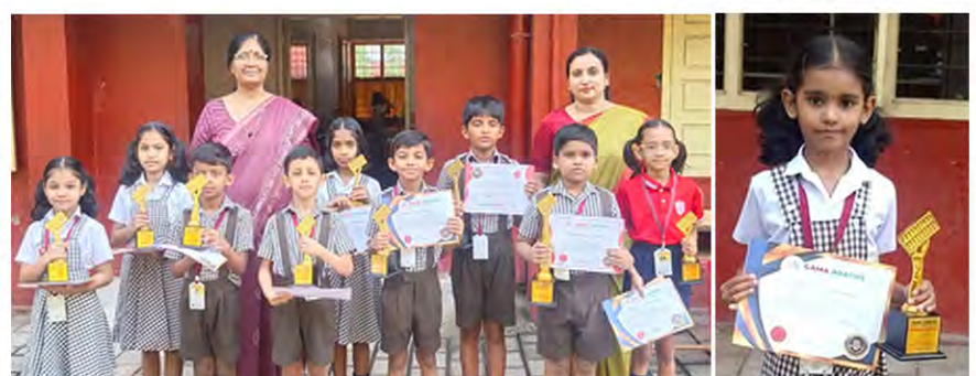
Abacus (Zonal) Contest Consolation Prize Winners (L.P. Section)