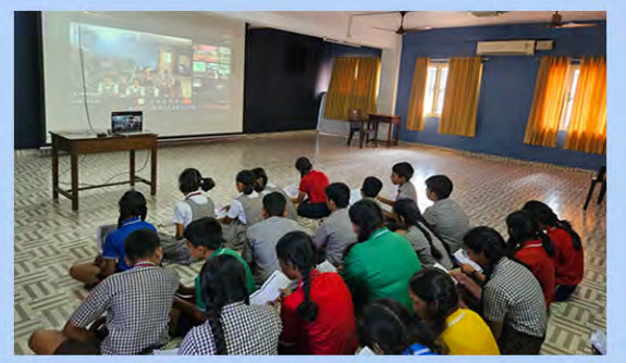
Online Gita chanting conducted by Chinmaya Mission, Thrissur Chapter