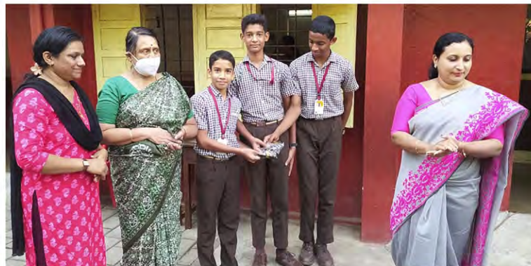
Class IX A: The best division in Grade 9