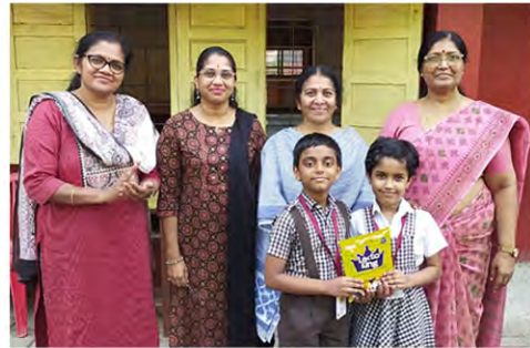
Class II B: The best division in Grade 2