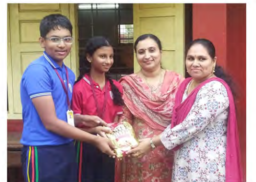
Class VII B: The best division in Grade 7