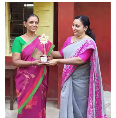
Class X A: The best division in Grade 10 and the best Class in High School Section