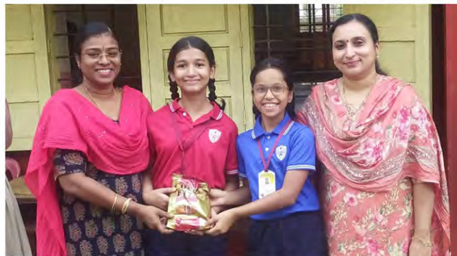
Class VI C: The best division in Grade 6