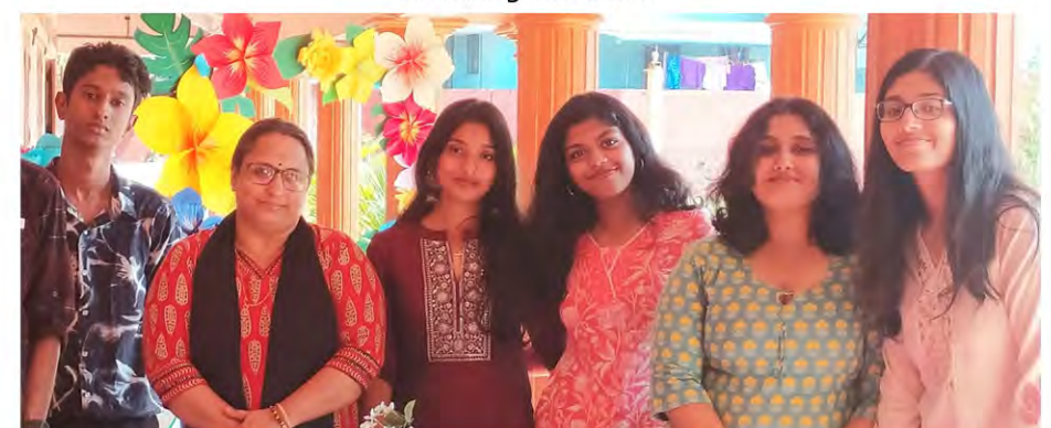
Entertainment Committee Members