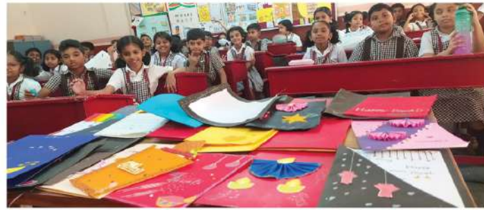
Diwali cards prepared by the L.P children

Next, the Upper Primary (UP) section stepped forward with a dazzling Diya-themed performance. With each child holding a glowing diya, they moved in perfect harmony, symbolically igniting not only the flames in their hands but also the light within every heart present in the hall. Their enthusiasm and infectious energy lifted the spirits of everyone watching.