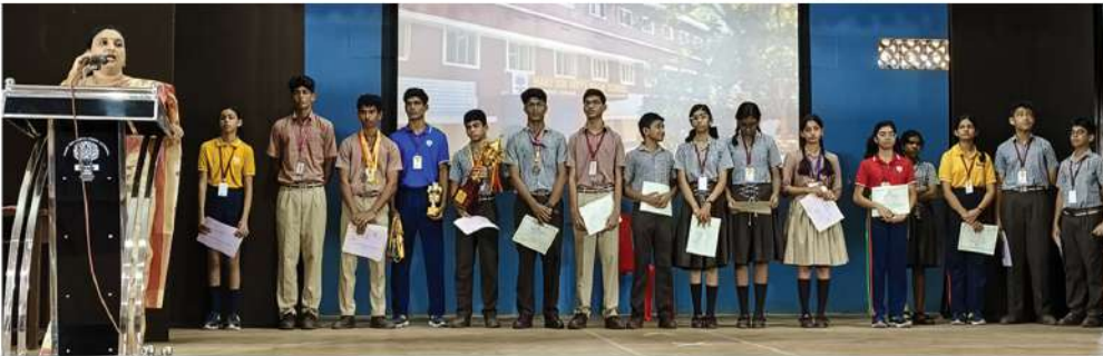
CISCE Regional Athletic Meet Winners with the E-Zone Overall trophy.