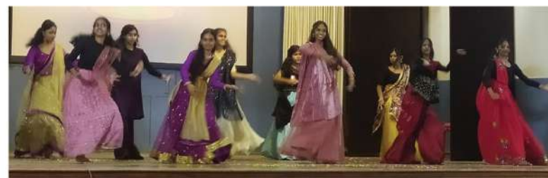
Dance performances by U.P, High School and Plus Two Sections in connection with the Diwali celebration at Hari Sri