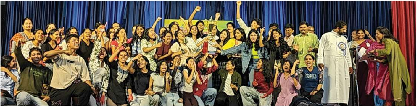
ASISC State Level Cultural Fest 2025 - Category 5 Winners with trophy