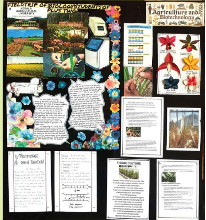
Project work done by the Plus Two Biology students after their visit to the Agricultural University