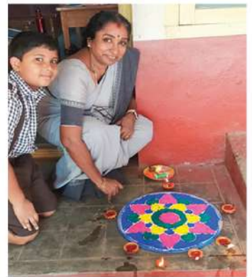
'Paper sweets' and Rangoli made by the L.P Section