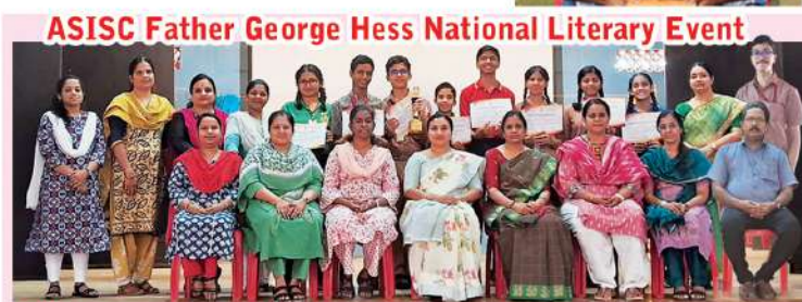
ASISC Father George Hess National Literary Event participants and the teachers who trained them along with the Principal