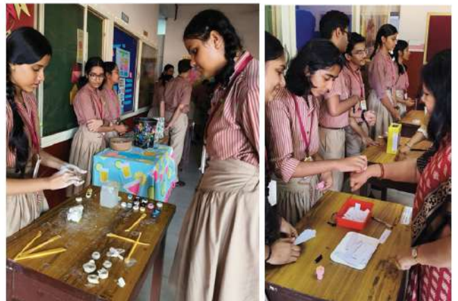
Children at work